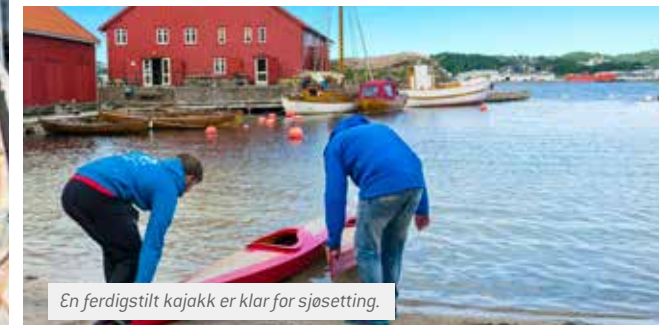
En ferdigstilt kajakk er klar for sjøsetting.