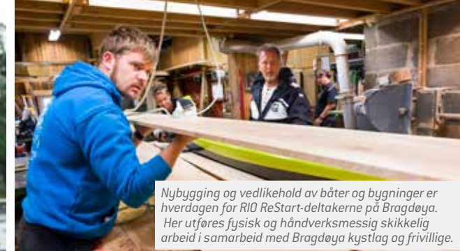
Nybygging og vedlikehold av båter og bygninger er hverdagen for RIO ReStart-deltakerne på Bragdøya. Her utføres fysisk og håndverksmessig skikkelig arbeid i samarbeid med Bragdøya kystlag og frivillige.