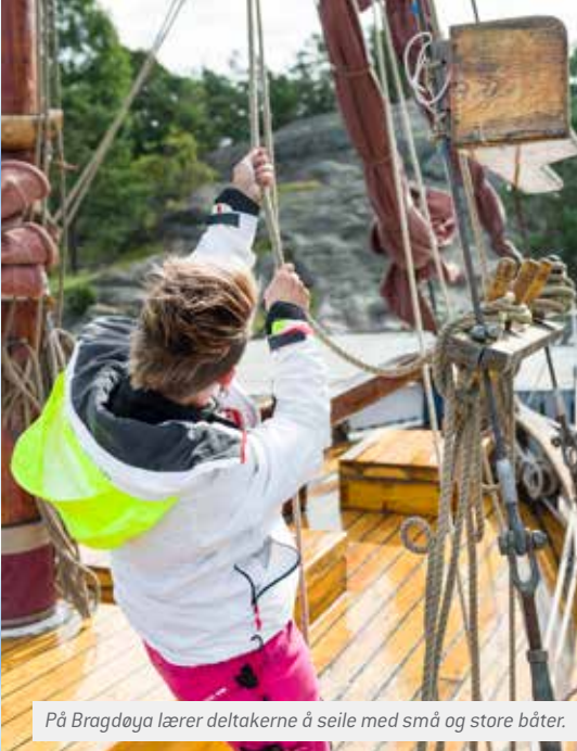
På Bragdøya lærer deltakerne å seile med små og store båter.